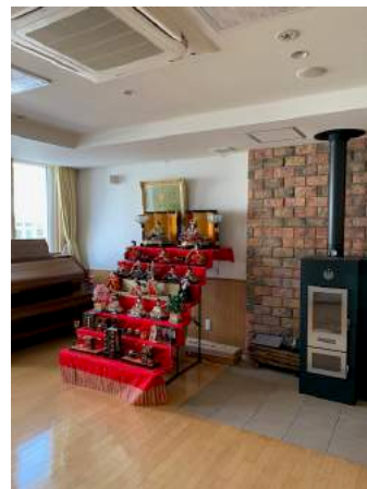
Hinamatsuri Puppenfest in Fujisono